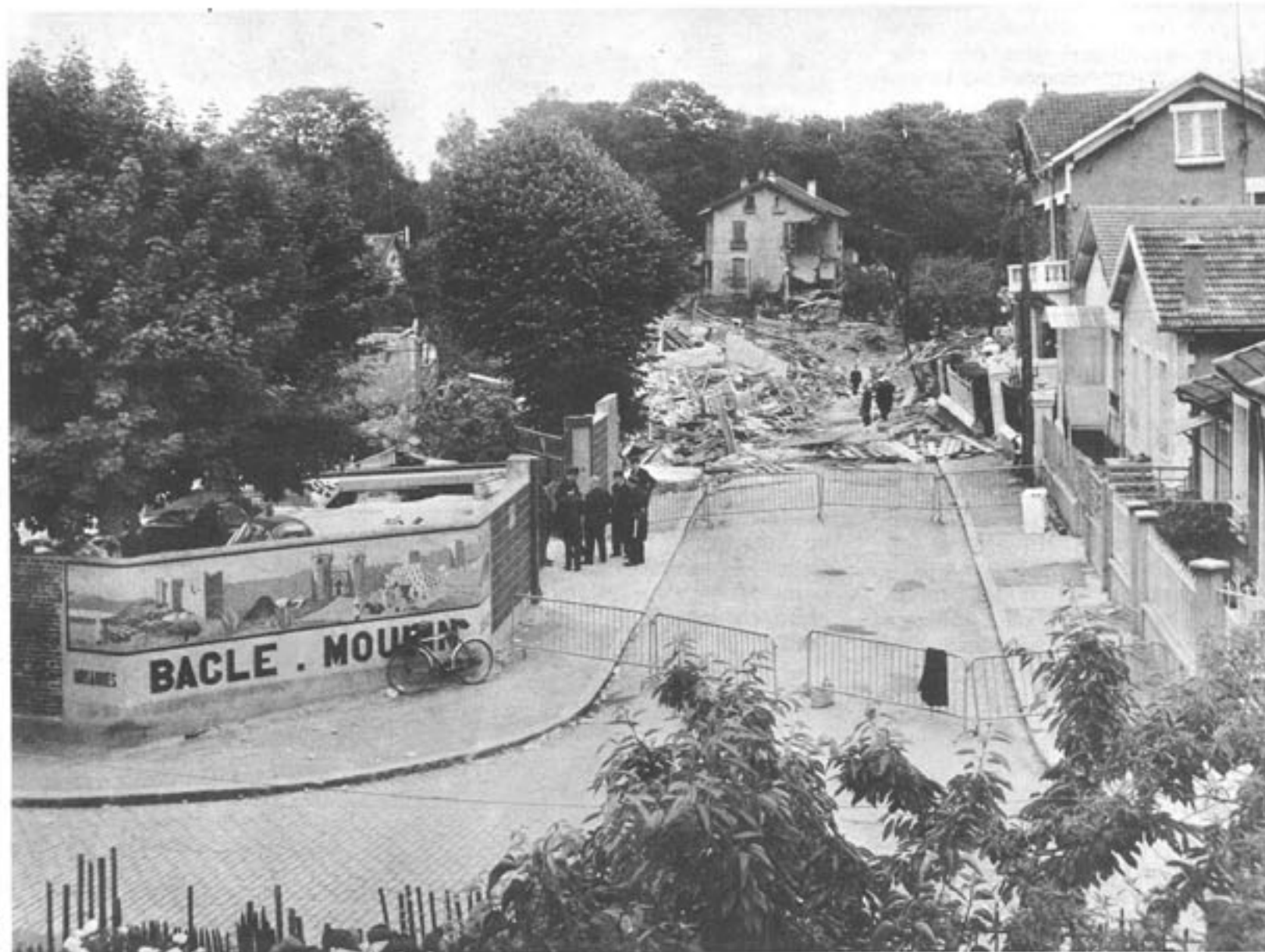
1961... Une terrible catastrophe s'abattait sur ce quartier d'Issy-les-Moulineaux

A ce vaste espace, il convient d'ajouter une propriété au n° 55 rue de l'Égalité.